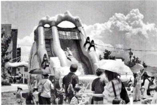
ウォータースライダー等の水遊び遊具

日差しを避けてテントや木陰で休む人も多く見られました。病人や事故発生もなく無事終了することができました。運営に関わった各区の皆さん、本当に疲れ様でした。