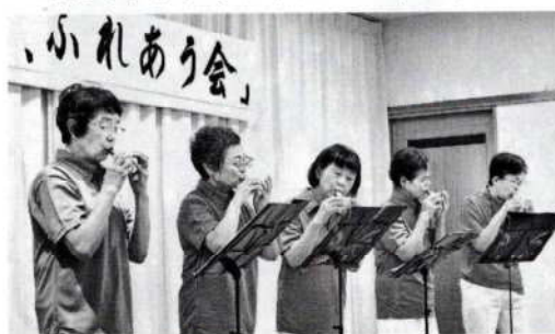
オカリナアンサンブル・スイートピー

1時間半ほどのアトラクションの後は、主催者の皆さんが朝早くから準備された豚汁とおにぎりの昼食を