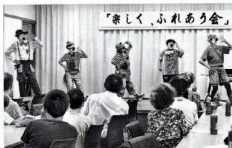
道化師サークル・わいわい遊び塾

おいしくいただきました。 主催：栗田町内会、福祉推進委員会、民生児童委員、日赤奉仕団、男女共同参画推進委員、育成会