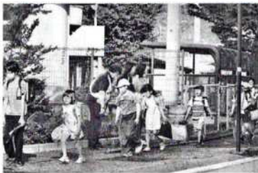
芹田小学校 (JA ながの芹田支所東側)