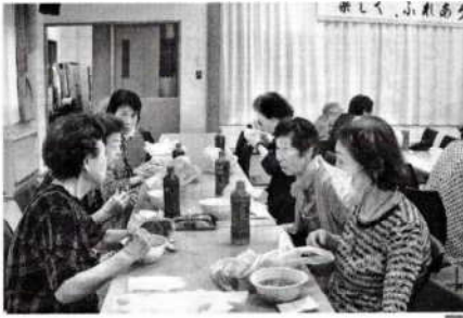
豚汁おいしかったです！