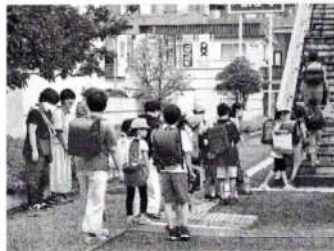
南部小学校 (学校前歩道橋西側)

夏休み明け、子ども達の元気な声・笑顔が通学路に戻ってきました。担当された町内会役員、民生児童委員、公民館役員、育成会の皆さん、ありがとうございました。