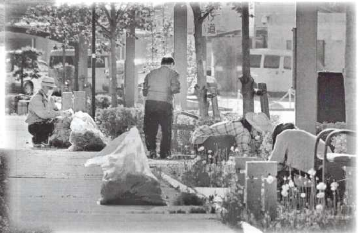
● 4月28日、駅南幹線愛護会 草取り、ゴミ拾い、参加者26名。