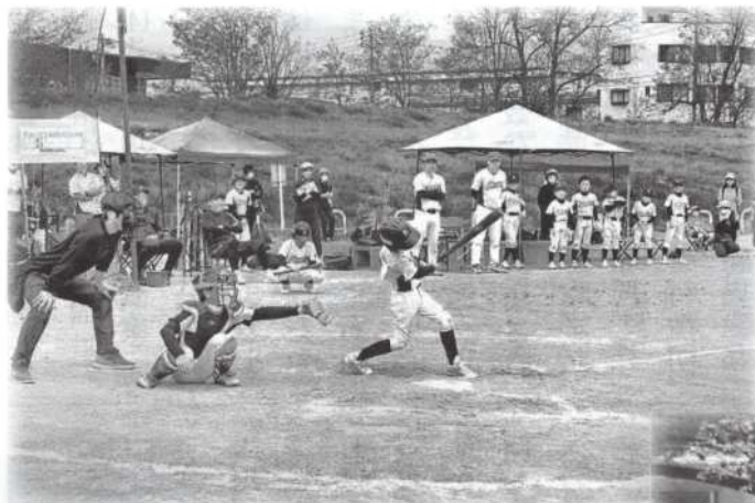
● 4月27日、栗田少年野球クラブ 安茂里松ヶ丘ジュニアカップ春季大会 (長野市犀川運動場)

5月1日から、栗田リサイクルハウスで「アルミ缶」の回収を開始しました。従来より市の資源ゴミの缶の回収日に出していましたが、今後はリサイクルハウスへの回収にご協力をお願いいたします。 ● アルミ缶は潰さないで出してください。 ● アルミ缶以外はご遠慮ください。 ● リサイクルハウスは24時間いつでも出すことができます。